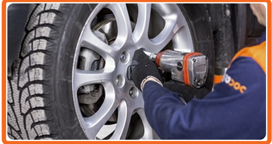
Sænk bilen og stram hjulboltene på kryds med.