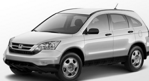
HONDA CR-V III